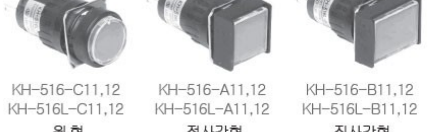
KH-516-C11,12 KH-516L-C11,12 원형