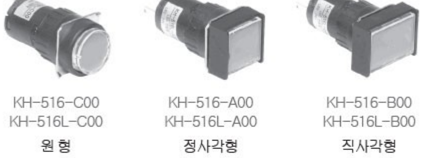
KH-516-C00 KH-516L-C00 원형