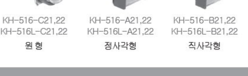
KH-516-C21,22 KH-516L-C21,22 원형