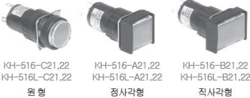
KH-516-C21,22 KH-516L-C21,22 원 형