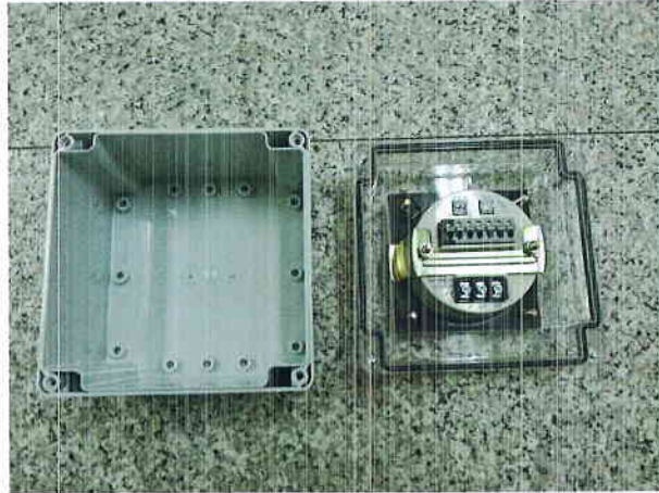
그림 4) 살수시험 후 시험품 내부(물침투 없음)