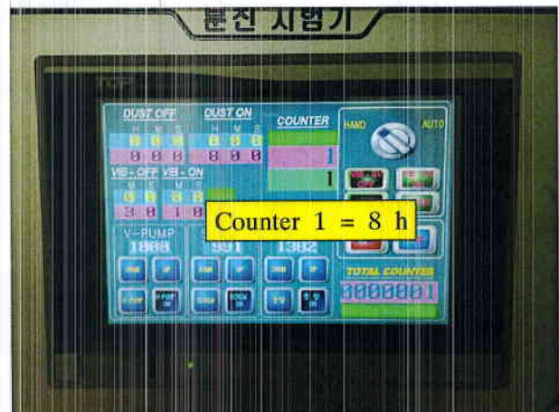
그림 3) 먼지시험 조건사진