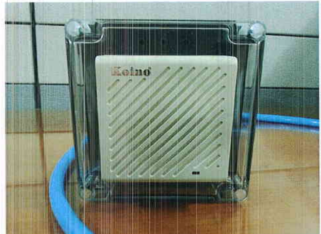
그림 1) 시험품 사진 : SIGNAL PHONE (KH-4065D)