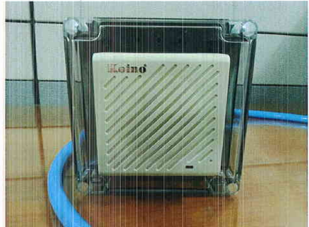
그림 1) 시험품 사진 : SIGNAL PHONE (KH-4065D)