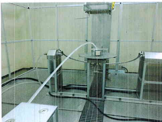
그림 2) 시험품 설치사진