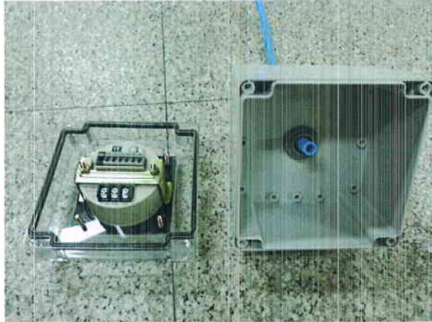
그림 4) 먼지시험 후 시험품 내부(먼지 침투없음)