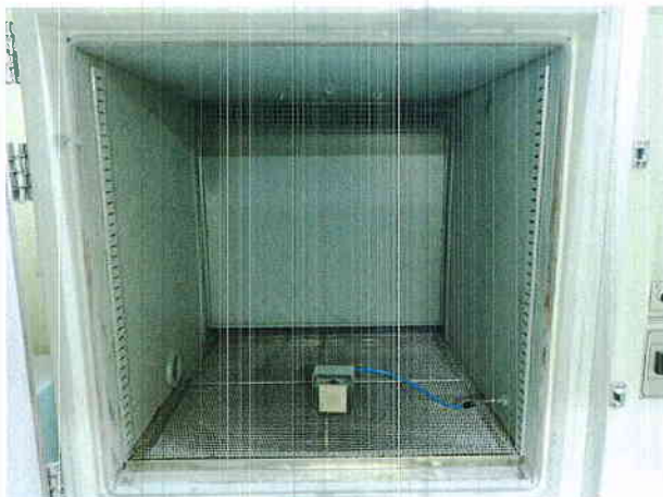
그림 2) 먼지시험 시험품 설치사진