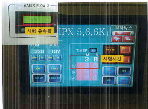
그림 3) 살수시험 조건사진